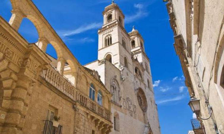
Kathedrale Santa Maria Assunta, Altamura

Friedrich II. von Hohenstaufen den Ort im 13. Jh. von griechischen, jüdischen und arabischen Siedlern zur Handelsstadt ausbauen ließ. Auch bekannt ist Altamura für seine große Anzahl an Kirchen, von denen wir heute einige besuchen.