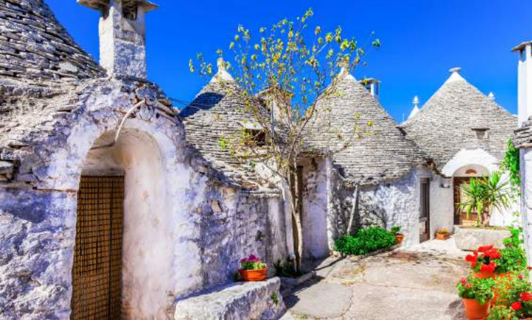
Trulli von Alberobello